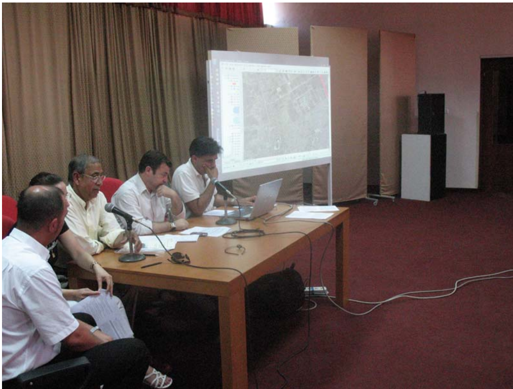
Takimi i kryer ne Pallatin e Kultures "A.Moisiu" dt. 16 Qershor 2009