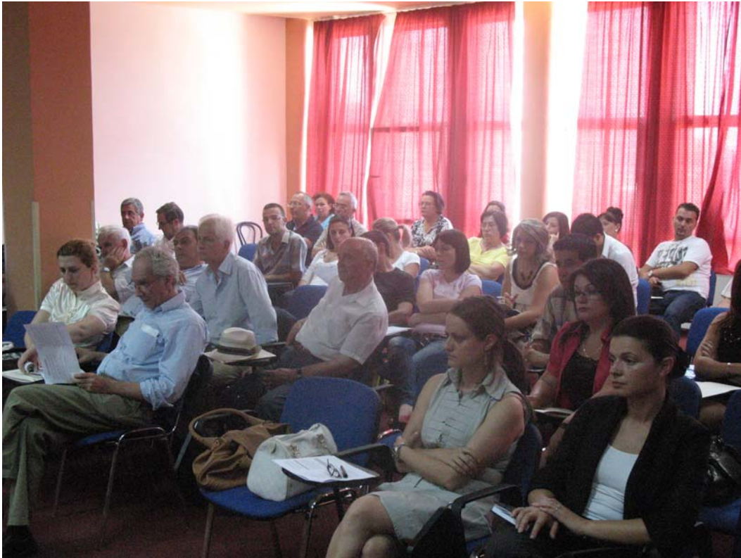
Takimi i kryer ne Pallatin e Kultures "A.Moisiu" dt. 16 Qershor 2009